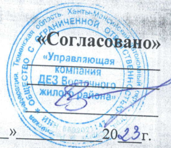
График на техническое обслуживание общего внутридомового газового оборудования ООО «УК ДЕЗ ВЖР» на 2023г.